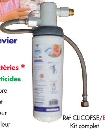
Réf CLICOFSE/B Kit complet 30 x 8 x 11 cm