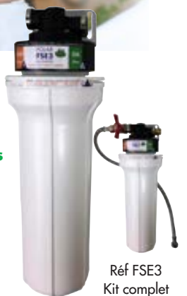
Réf FSE3 Kit complet 35 x 11 x 12 cm