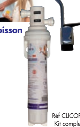
Réf CLICOFB Kit complet 25 x 8 x 11 cm