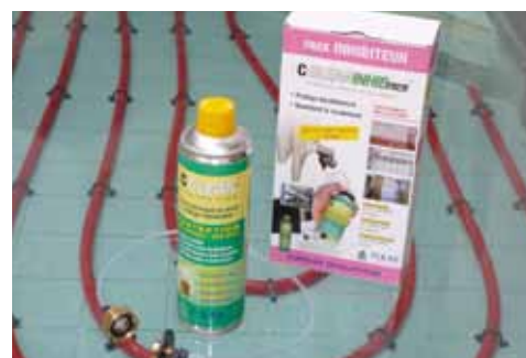
Kit Inhibiteur Plancher chauffant Radiateur aluminium - Chaudière neuve

Agrément AFSSA ANSES 2010-SA-0284 - Liste A Pour circuit à simple échangeur