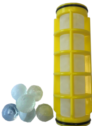
Kit de remplacement tamis + silico-phosphate Ref. : TFY34ESP-2