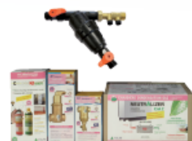
GAZ SOL 35 kW