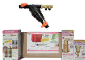
FIOUL CERAM SOL 25 kW