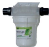
réf. NEUTR 12GAZ

3 rendement obligatoire du chauffage condensation (ErP+ Eco-Design)