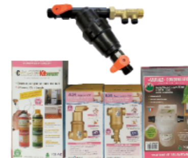
PACK GAZ MURALE 24 kW réf. ERP GM 24