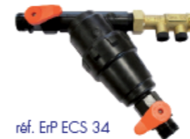
réf. ErP ECS 34

4 rendement obligatoire du chauffe-eau (ErP + Eco-Design)