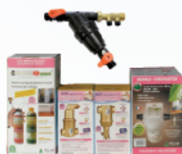
GAZ MURALE 24 kW