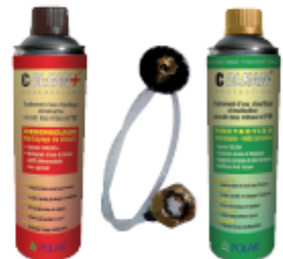
réf. CCLEANKIT : CCLEAN B/R/I

2 nettoyage du circuit obligatoire (Costic 13.215/216)